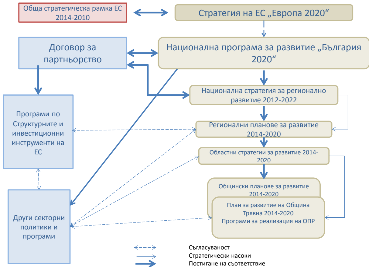
Схема 1: Мястото на Плана за развитие на Община Трявна 2014-2020 г. в цялостния процес или йерархия на планиране

Мястото на Плана за развитие на Община Трявна в цялостната система за стратегическо планиране, както е посочено в Методически указания за разработване на Националната стратегия за регионално развитие на Република България (2012-2022), Регионални планове за развитие на районите от ниво 2 (2014-2020), Областни стратегии за развитие (2014-2020), Общински планове за развитие (2014-2020) на МРРБ е илюстрирано в схемата по-долу: